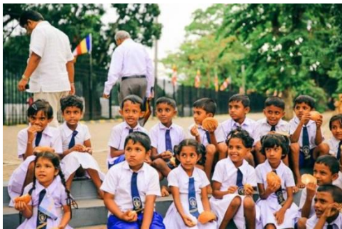
聖城康堤：全世界最純粹的信仰