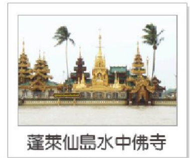
蓬萊仙島水中佛寺

早餐後，首先專車前往【郊丹佛-蓬萊仙島水中佛寺Kuaktan Pagoda】沿途您可覽田園鄉村景色。經過橫越浩大的伊洛瓦底江的「丁茵大橋」。抵達江口時需改小船至『蓬萊仙島水中佛寺』(KYAIK MAW WUN PAGODA)